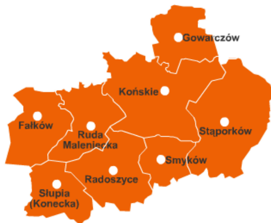
Rysunek 1. Powiat Konecki w podziale na gminy.

Powiat konecki zajmuje 1140 km 2 , położony jest w północno – zachodniej części województwa świętokrzyskiego. W skład powiatu wchodzi 8 gmin.